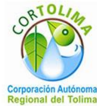
Corporación Autónoma Regional del Tolima