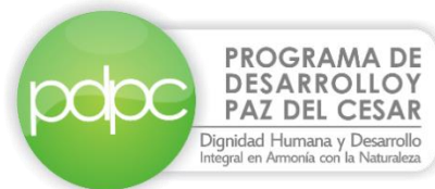
Programa de Desarrollo y Paz del Cesar