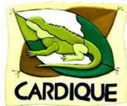
Corporación Autónoma Regional del Canal del Dique