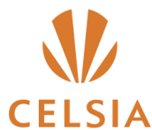
Empresa de energía del pacífico