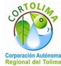
Corporación Autónoma Regional del Tolima