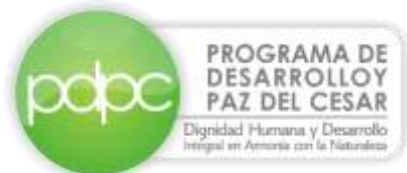
Programa de Desarrollo y Paz del Cesar