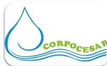
Corporación Autónoma Regional del Cesar