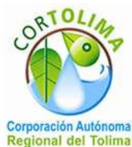
Corporación Autónoma Regional del Tolima