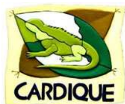
Corporación Autónoma Regional del Canal del Dique